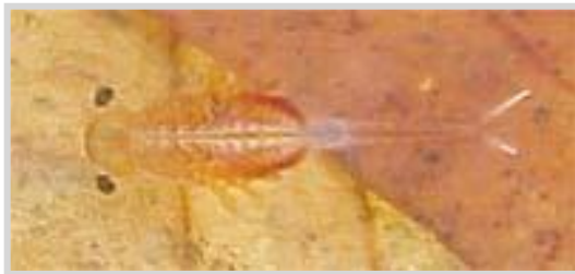
Los camarones de hadas comen detritus.

Las pequeñas criaturas en realidad nadan boca abajo. Si los miras