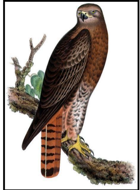
Esta pinura muestra un halcón de cola roja.

A próxima vez que pases por prados y campos, mira en los árboles, los postes de la cerca y los postes de teléfono. A la vez, veas un halcón de cola roja buscando en el campo a su presa.