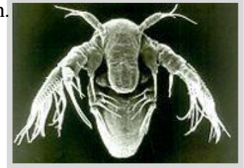
Las larvas de camarones de hadas crecen en estanques vernales

Una vez que la piscina se vuelve a mojar, los huevos eclosionan. De esta manera, la población de camarones de hadas puede sobrevivir en el estanque vernal de un manantial a otro. Los huevos también pueden ser transportados de un estanque vernal a otro por el viento o por animales que viajan.