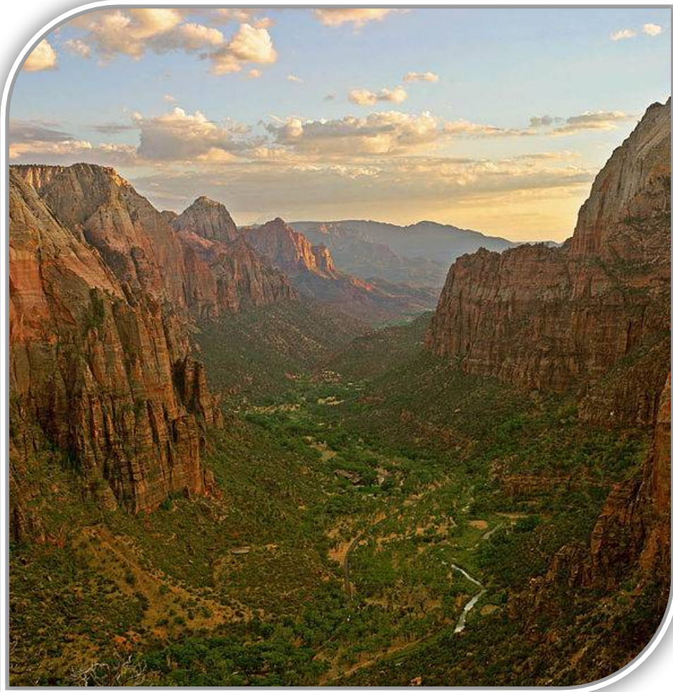
El Cañon de Zion durante el puesto de sol en el parque nacional Zion desde el punto de Angels Landing mirando al sur