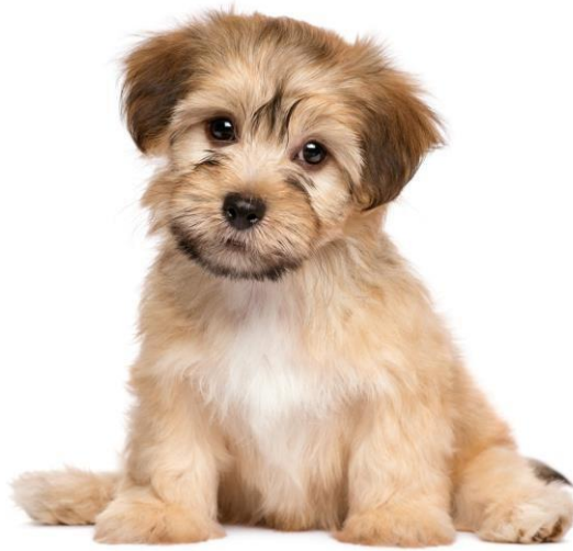
Una Buena mascota

Los perros hacen buenas mascotas. La mayoría de los perros son muy cariñosos. Les